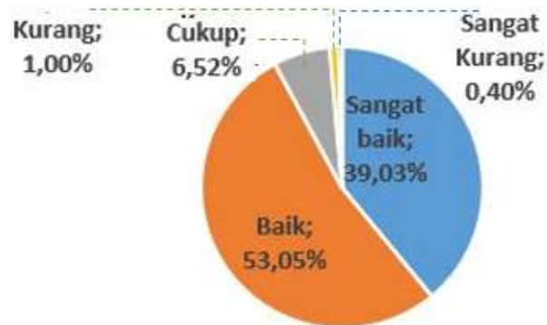
Gambar 2. Rerata Persepsi Respon Kinerja Dosen FBS UNY Akhir Semester Gasal T.A. 2019/2020

Penjaminan mutu di Fakultas Bahasa dan Seni berjalan dengan baik, diantaranya dengan selalu dilakukan monitoring perkuliahan setiap semesternya. Dalam satu semester dilakukan dua kali evaluasi proses pembelajaran, yaitupada awal semester dan pada akhir semester. Proses monitoring diselenggarakan dengan cara mahasiswa mengisi angket secara daring. Berikut hasil rata-rata persepsi respon kinerja dosen di akhir semester gasal tahun Akademik 2019/2020.