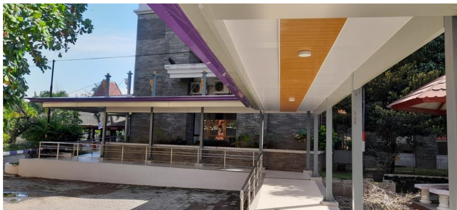
Gambar 3. Foto tampilan Dorloup di sisi selatan gedung Performance Hall yang sudah disesuaikan dengan lingkungan.