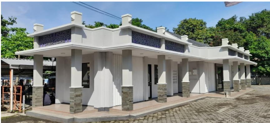
Gambar 3. Foto Gedung Unit Usaha dari sisi kanan yang sudah disesuaikan dengan lingkungan.

Tahun 2021 juga dilakukan pemeliharaan dan renovasi dorloup dari gedung Ki Nartosabdo sampai ke gedung PLA. Pemeliharaan dan renovasi dilakukan dengan membuat dorloup yaitu membuat atap peneduh jalan sepanjang gedung Ki Nartosabdo sampai gedung PLA.