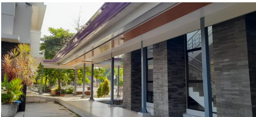
Gambar 3. Foto Dorloup di sisi barat gedung Performance Hall yang sudah disesuaikan dengan lingkungan.

Fakultas juga melakukan pemeliharaan pada bagian taman-taman yang ada di lingkungan FBS. Pemeliharaan taman bertujuan untuk menata dan memperbaiki tampilan taman agar lebih bersih. Penataan taman juga meliputi penebangan beberapa