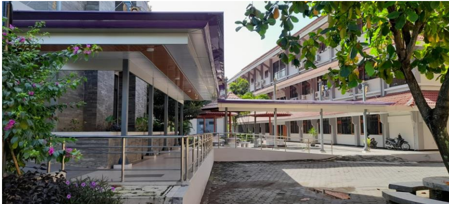
Gambar 3. Foto Dorloup di sisi selatan gedung Performance Hall yang sudah disesuaikan dengan lingkungan.