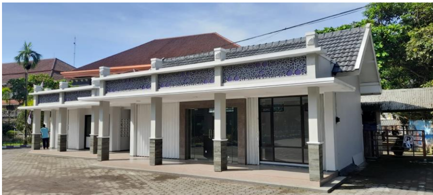
Gambar 2. Foto Gedung Unit Usaha dari sisi kiri yang sudah disesuaikan dengan lingkungan.