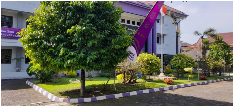
Gambar 3. Foto Taman di sisi barat gedung PLA yang sudah disesuaikan dengan lingkungan.

pohon-pohon yang dirasa dapat menimbulkan bahaya karena tumbang, mengingat cuaca sedang memasuki musim penghujan.