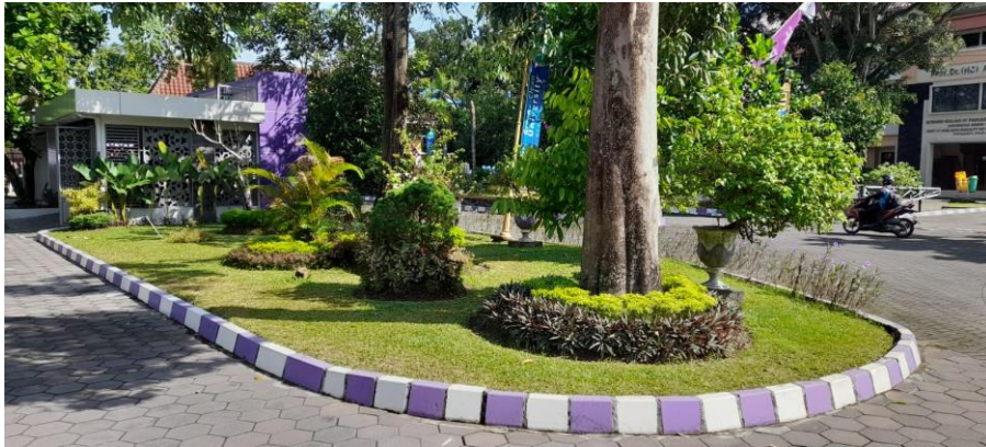
Gambar 3. Foto Taman di sisi barat bundaran PLA yang sudah disesuaikan dengan lingkungan.