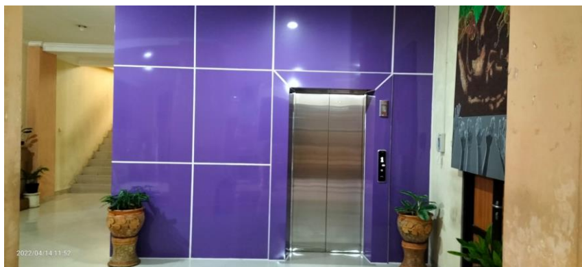
Gambar 1. Foto Lift di sisi gedung WS Rendra yang sudah disesuaikan dengan lingkungan.

Pada tahun 2021 FBS UNY mengalokasikan anggaran belanja modal konstruksi. Pengadaan yang dilakukan di FBS pada tahun 2021 ialah pengadaan lift pada gedung WS Rendra (GK I). Pengadaan lift di gedung WS Rendra bertujuan untuk memfasilitasi dosen/mahasiswa yang berusia lanjut, bekebutuhan khusus, atau disabilitas.