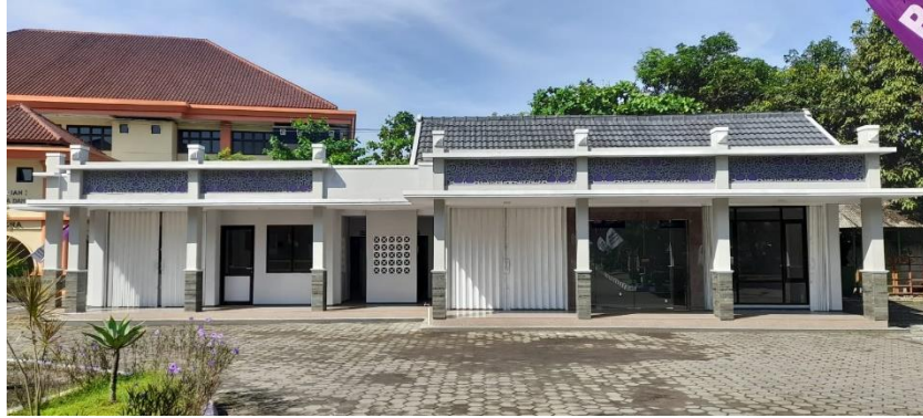
Gambar 1. Foto Gedung Unit Usaha dari sisi depan yang sudah disesuaikan dengan lingkungan.