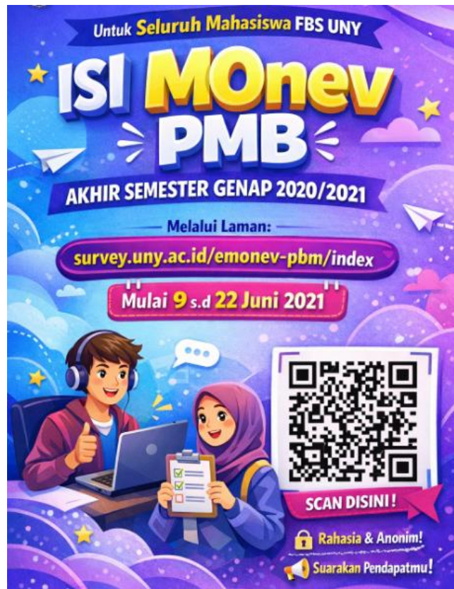
Gambar Jadwal Monev PBM Tahun 2021