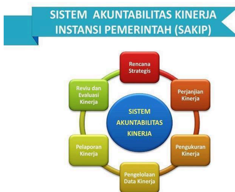
Gambar 1. Sistem Akuntabilitas Kinerja Instansi Pemerintah (SAKIP)

Dengan demikian, Renstra FBSB tidak hanya menjadi dokumen perencanaan, tetapi juga instrumen pengendali yang memastikan bahwa seluruh program dan kegiatan fakultas dapat berjalan secara terarah, berkesinambungan, serta memberikan kontribusi nyata terhadap pencapaian kinerja UNY di tingkat nasional maupun internasional. Di bawah ini 6 SAKIP Pemerintah.